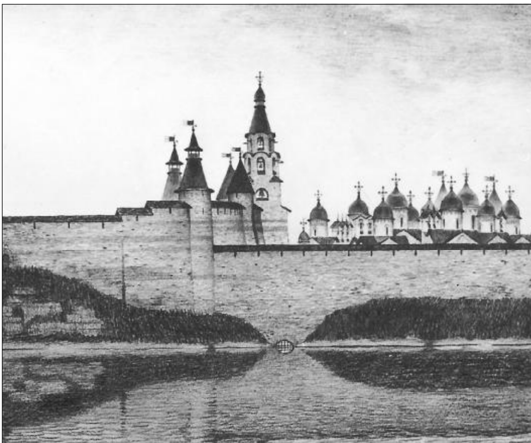
Перси Пскова с колокольней 1465 года и комплекс храмов Довмонтова города. Вид из-за реки Великой (реконструкция).

Однако прошло время и все начало меняться. В 1510 году была ликвидирована Псковская боярско-вечевая республика. По приказу великого московского князя Василия III было устранено Вече. Кром был очищен от родовых клетей и общественных складов, а сами боярские рода - 300 «лучших людей» - было указано вывести в Москву и другие русские города. «Месяца января в 13... спустиша Вечной колокол Святая Живоначальная Троица и начаша псковичи, на колокол смотря, плакати по своей старине и по своей воли... И тогда отняшеся Слава Псковская!»