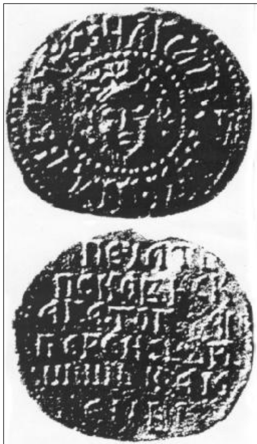
Печать Псковского господарства с надписью о Персях 1425 года.

Еще в 1425 году псковичи учредили особенную государственную печать с надписью: «Печать псковскага. Тогда и Перси свьрьшишь камены». Историки до сих пор считали, что могучее и древнейшее оборонительное сооружение символизировало