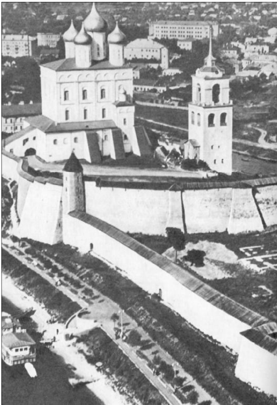
Перси - стенная грудь Псковского Крома, и бывшая Вечевая площадь перед Троицким собором.