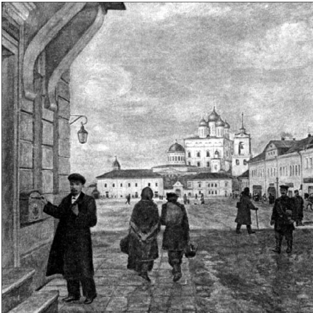
Весна в Пскове. 1900 г. С картины худ. Г. Алексеева-Гая.