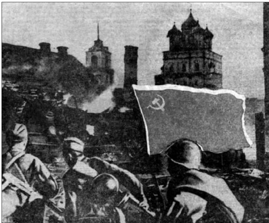
Бои на улицах Пскова в июле 1944 года