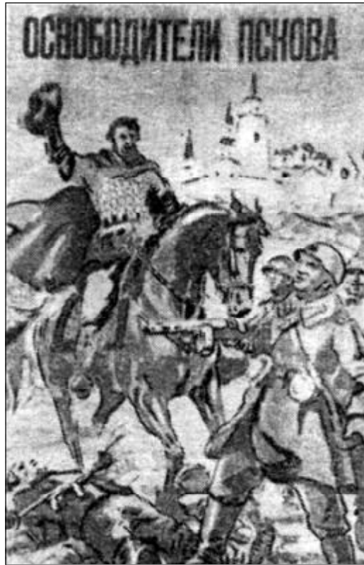
Плакат 1944 года