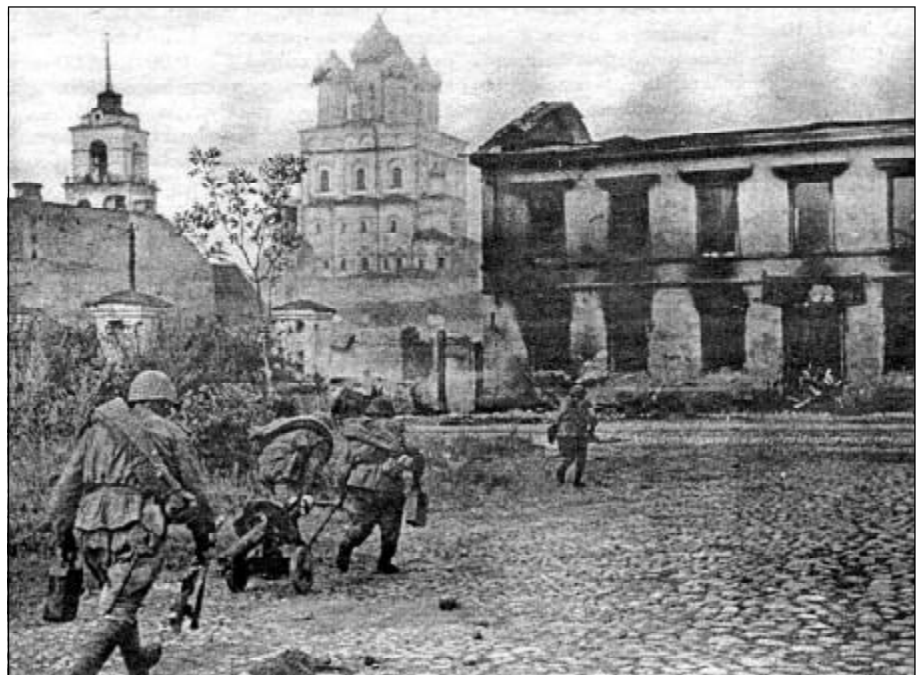
Бой на улицах Пскова