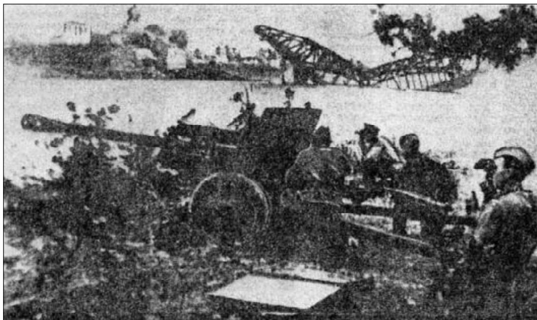
Форсирование р. Великой