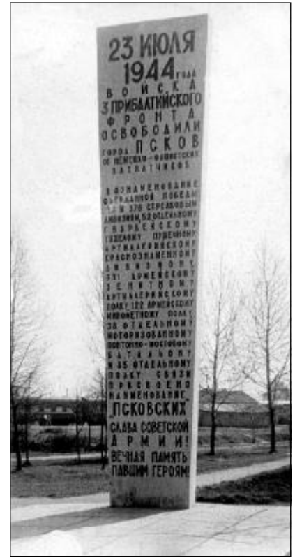
Стела с надписью в честь освобождения Пскова