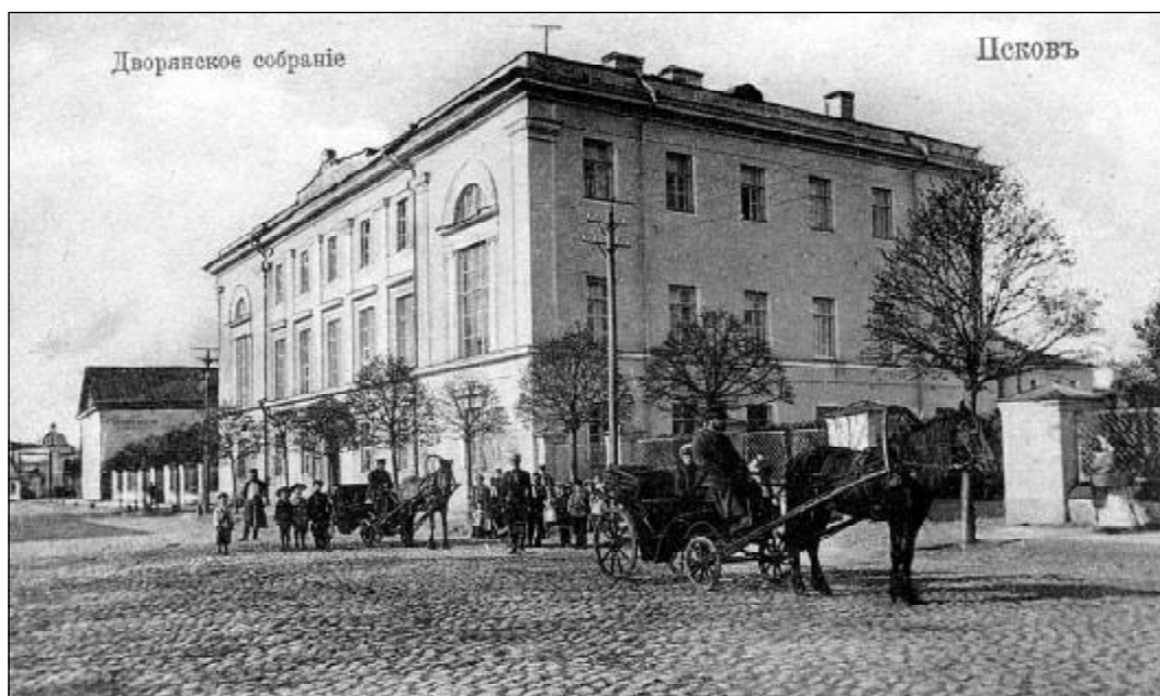
Дом Дворянского собрания.