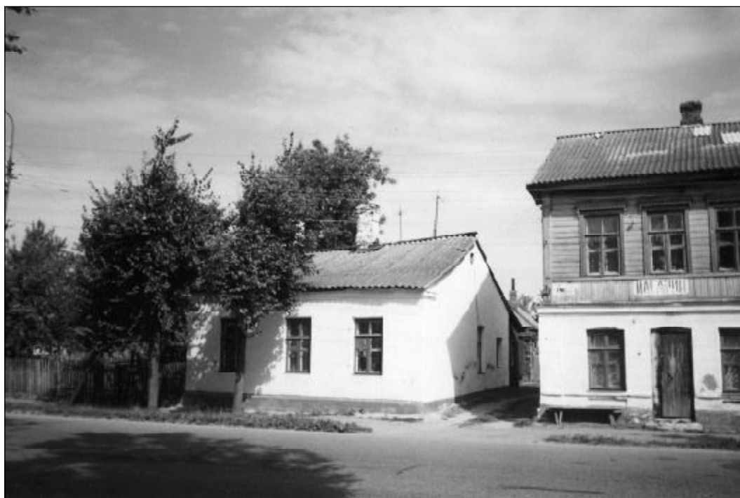
Сохранившаяся часть (слева) бывшего дома купца Калашникова Остров, ул. 25-го Октября, 55.