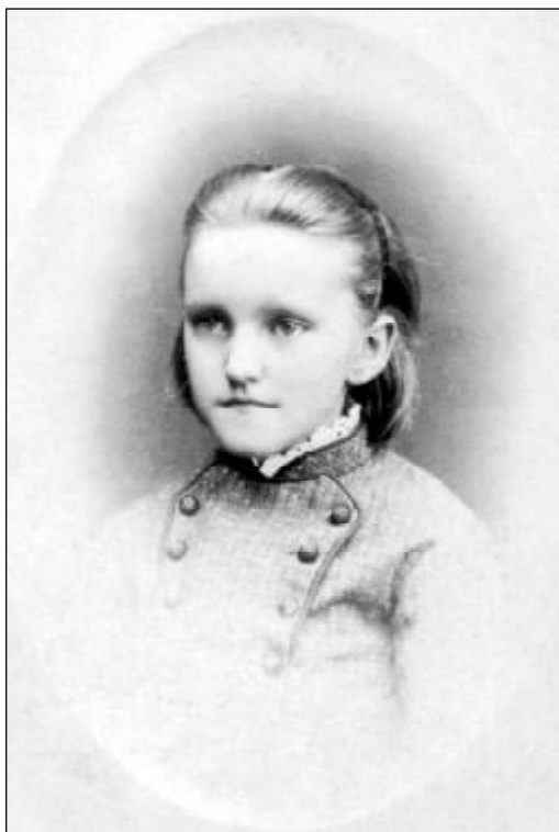
Маруся Калашникова Фото 50-х гг. XIX в. из фондов Музея-института семьи Рерихов в Санкт-Петербурге Публикуется впервые