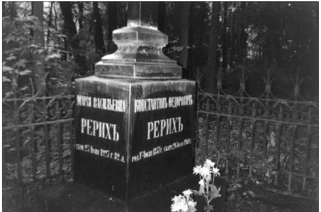
Могила Марии Васильевны и Константина Федоровича Рерихов Санкт-Петербург, Смоленское кладбище.