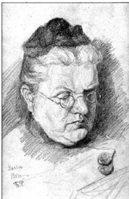
Борис Константинович Рерих Портрет матери. 14 января 1903г. Рисунок из Мемориального собрания С.С.Митусова в С.-Петербурге