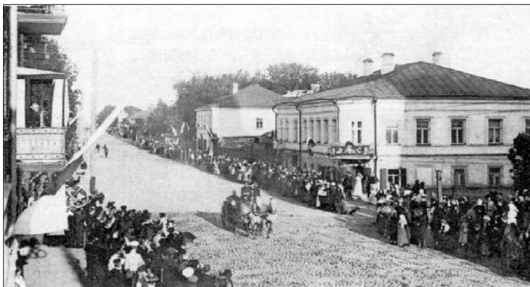
Псков. Сергиевская улица.