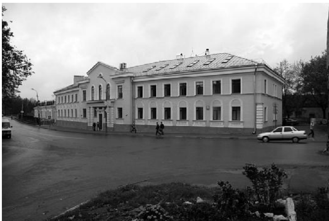
Учебный корпус по ул. Л. Поземского, д. 6 введен в эксплуатацию в 2007 г.