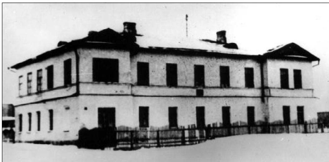
Здание общежития института по улице Леона Поземского.