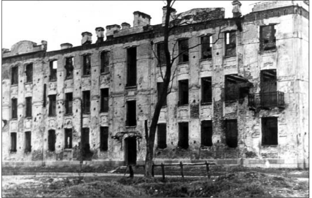
Здание института после освобождения Пскова в 1944 г.