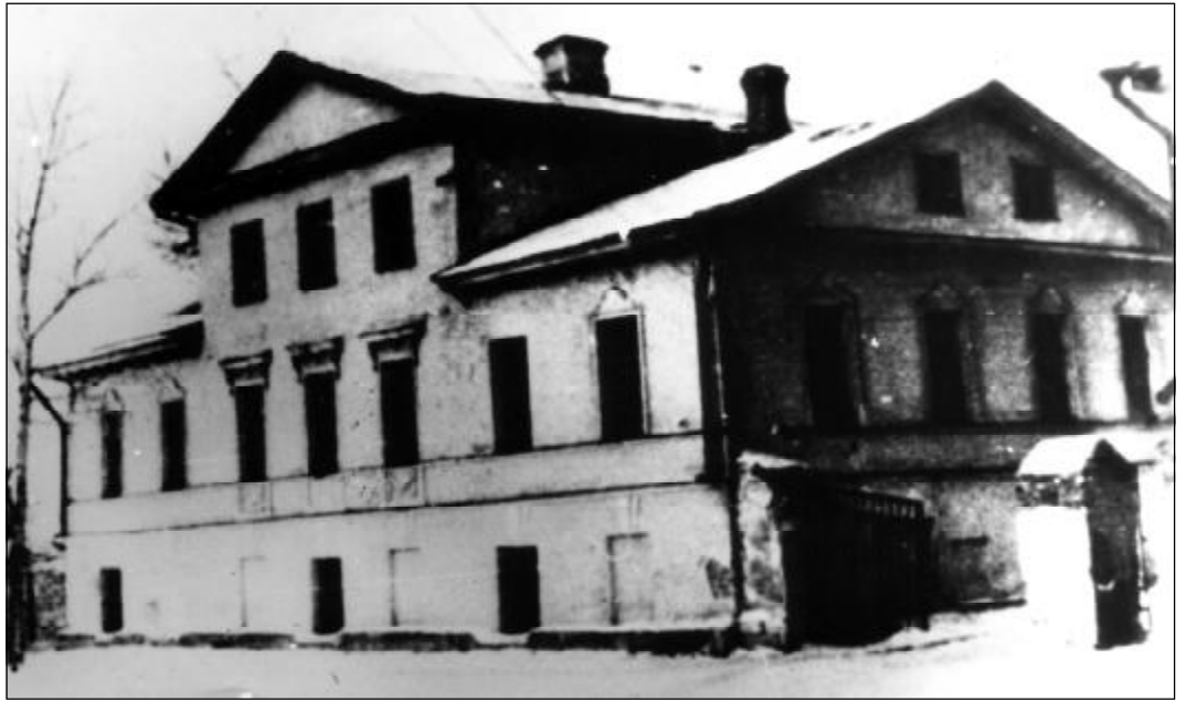
Здание общежития по ул. Первомайской