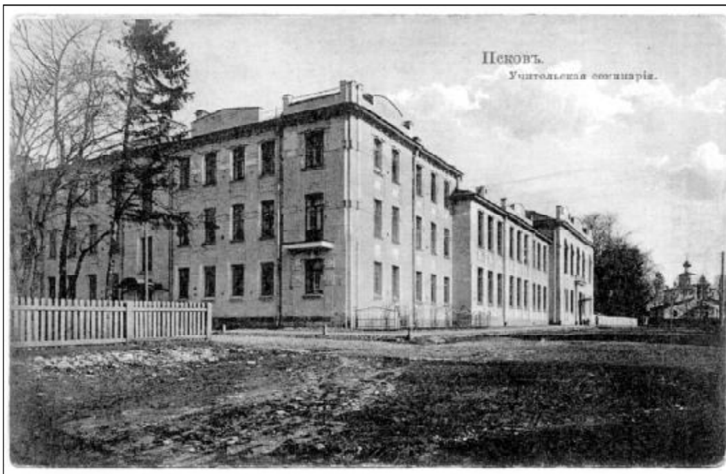
Педагогический институт начал работу 17 октября 1932 года в здании дореволюционной учительской семинарии.