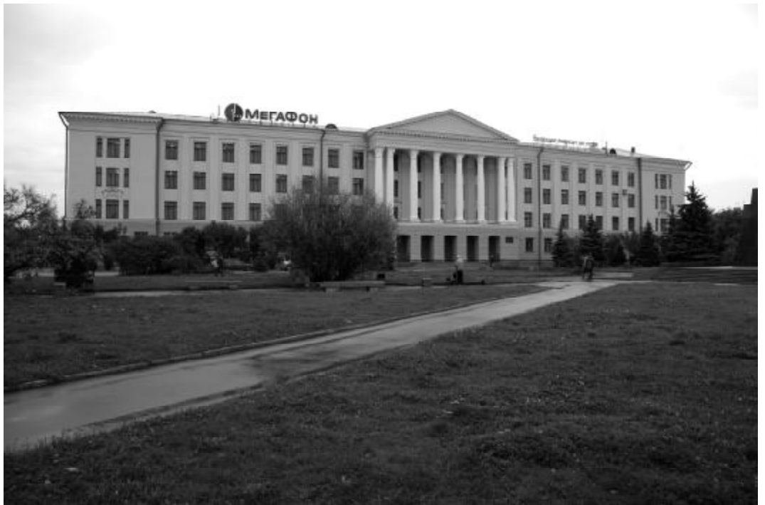
Новое здание института на пл. Ленина, построено в 1960 г.