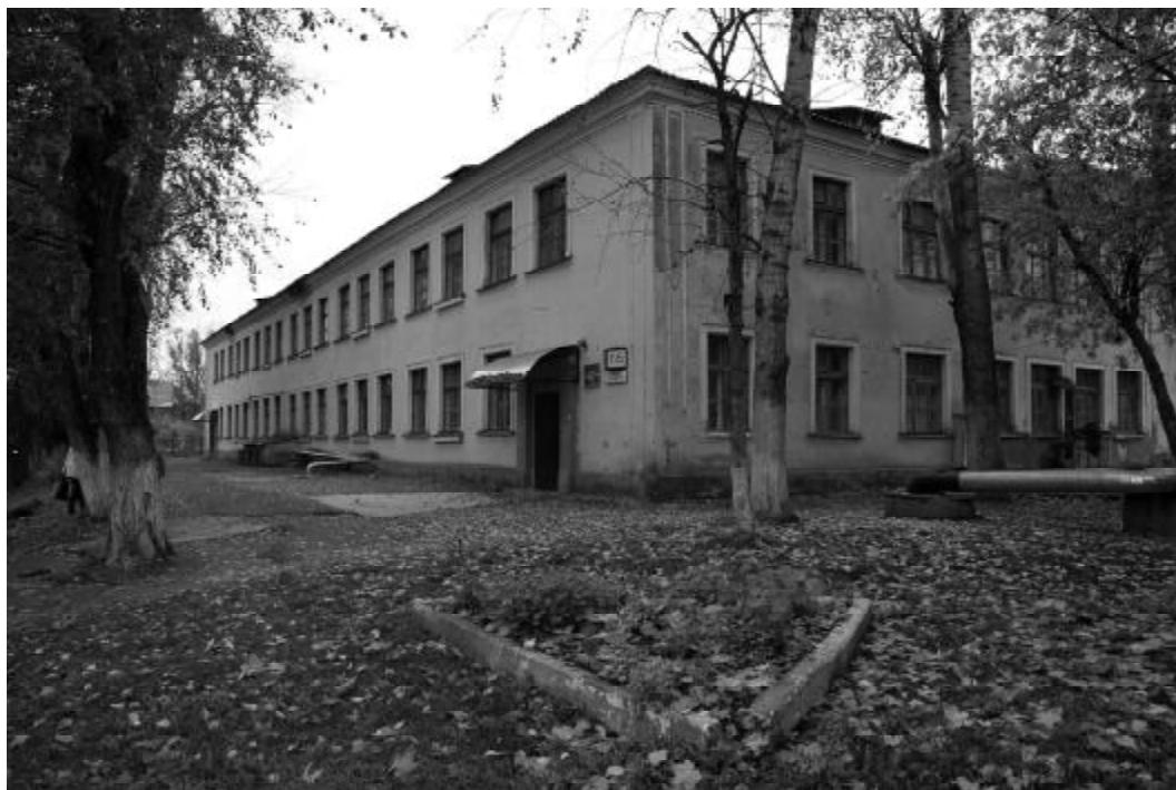
В здании школы №6 г. Пскова институт работал в 1946-1947 учебном году.