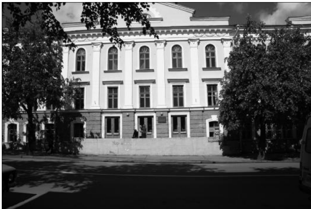
В 1991 г. институту передано здание Общественно-политического центра Обкома КПСС по ул. Некрасова.