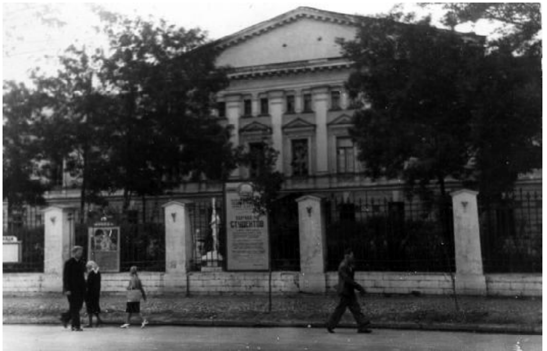
В восстановленное здание по ул. Советской, д. 21, институт переехал в 1947-1949 гг.