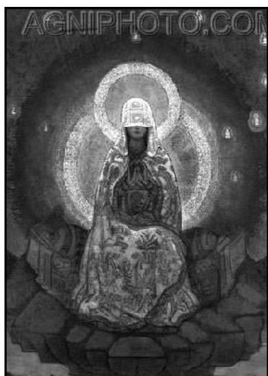
Матерь Мира, 1930 г.