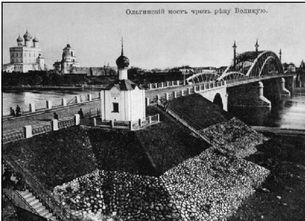
Анастасиевская часовня 1911 г.