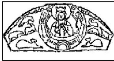
Прорисовка ч. Св. Анастасии в Пскове