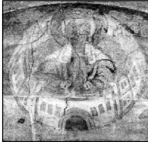
Фрагмент росписи ч. Св. Анастасии в Пскове