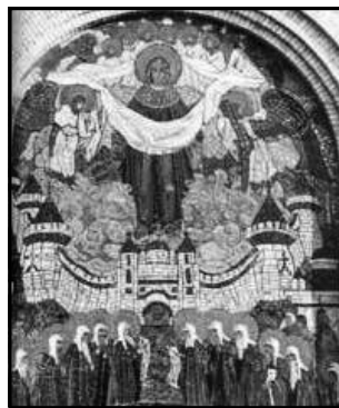
Село Пархомовка. Покров Богородицы 1906-1908 гг.