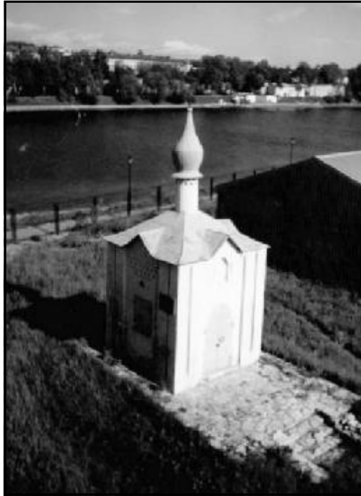
Анастасиевская часовня. Фото 2004 г.