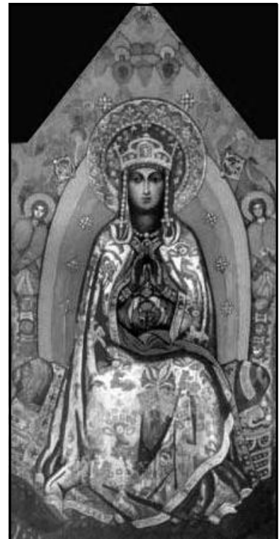
Эскиз ц. Св. Духа в Талашкине 1911-1914 гг.