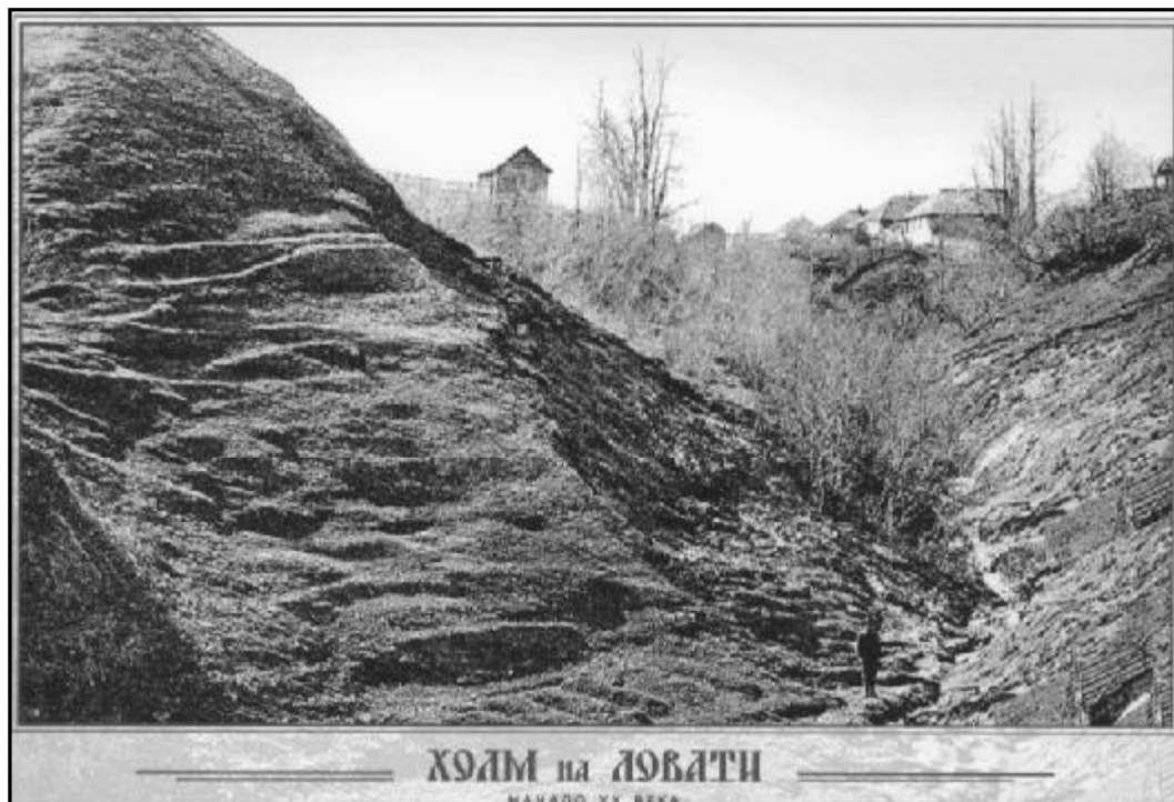
Татиловский овраг. Почтовая открытка. Издание П. И. Киримитчиева. Начало XX века

Холмская крепость по всему периметру была обнесена рубленой деревянной стеной. С северной стороны от Ловати до ручья она проходила по вершине земляного вала, далее по кромке Татиловского холма и по левому берегу Ловати. Можно предполагать, что с приступной стороны крепость могла иметь двойные стены,