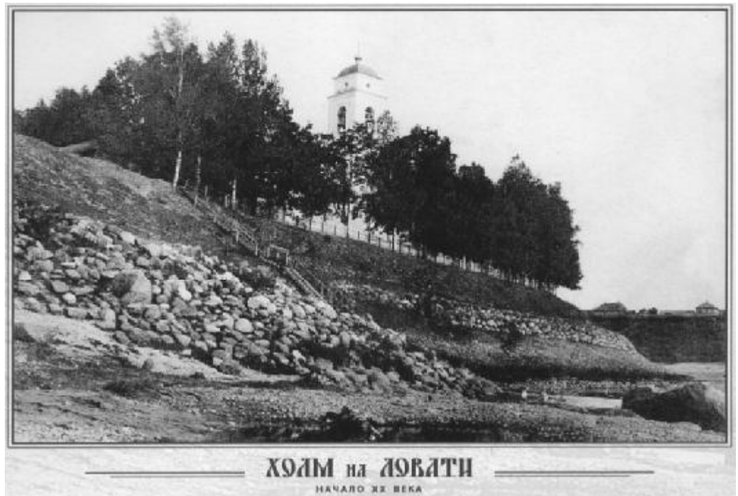
Тагиловское городище и посад с Воскресенской церковью. Вид с запада. Фото начала XX в.

Прибрежная сторона холма совпадает с обрывистым берегом Ловати, высота которого в верхней (северной) части достигает 29,4 м, а в нижней (южной) - 24,2 м. Высота восточного по берегу бывшего ручья и южного краев холма - в пределах 10-11 метров. Как утверждают специалисты, южная сторона холма - это древний берег Ловати. Однако под влиянием встречных водных потоков при впадении Куны в Ловать и в результате аккумуляции (накопления) наносного материала, и прежде всего песка в период половодья, Ловать постепенно отступала к югу. Таким образом образовалась терраса, на которой позже разместился посад.