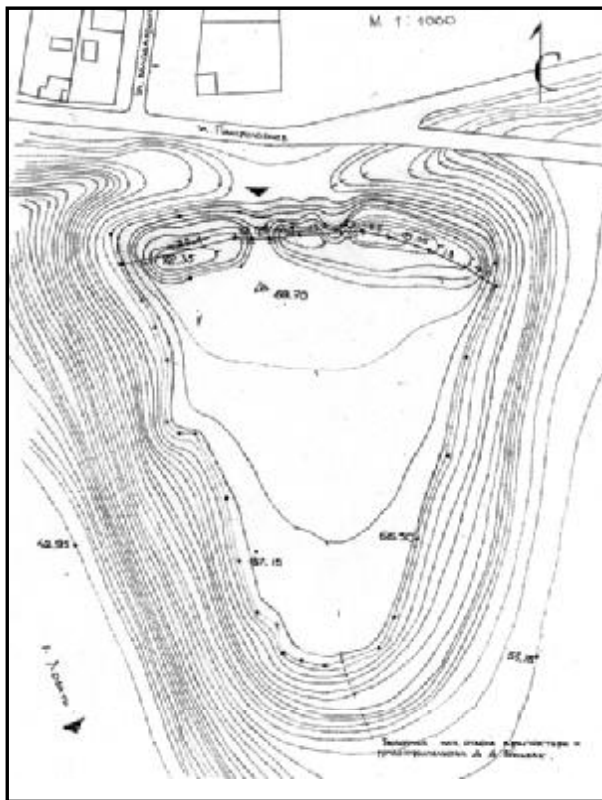
Рис. 1. План Татиловского холма-городища. Геодзическая сьемка А. И. Судакова. Обмер холмского архитектора Д. А. Бульбаха. Октябрь 2007 г. Масштаб 1:1000. Уменьшено.

Новые крепости, как правило, ставились на старых городищах, т.к. их естественные преграды рельефа усиливали создаваемые руками человека искусственные укрепления: рвы, валы, стены и башни. Если исходить из того, что и Холмская крепость XVI в. также была поставлена на старом городище, то в таком случае ров только углублялся и укреплялись валы, а заново возводились лишь стены и башни. Известно, что однотипная Себежская крепость 1535 г. была возведена, по одним данным, в течение месяца и одиннадцати дней, по другим - за три недели на средства особого