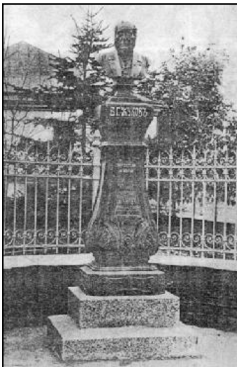
Бюст В.Г. Жукова

27 ноября в присутствии губернатора графа А. В. Адлерберга и при громадном стечении народа состоялось освящение и открытие железного моста. Впрочем, земляные работы возле моста, необходимые для нормального движения, ещё продолжались. В частности,