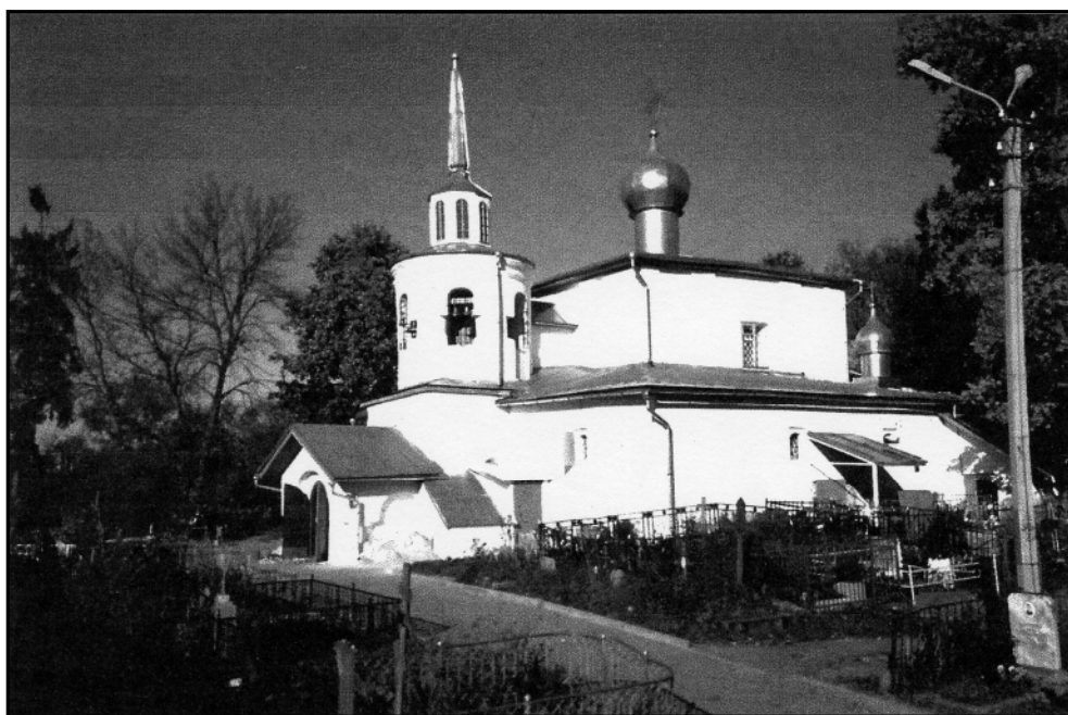
Современный вид церкви. Октябрь 2005 г.