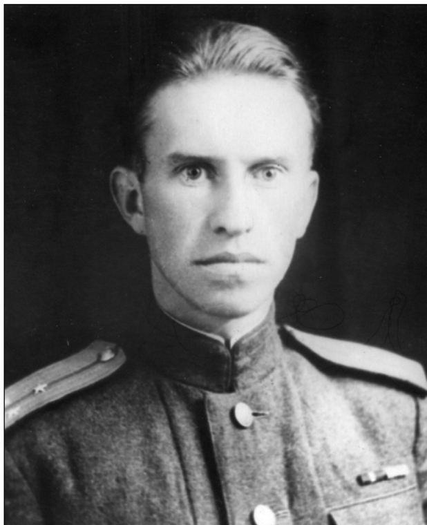
Н. И. Макаров. 1944 г.